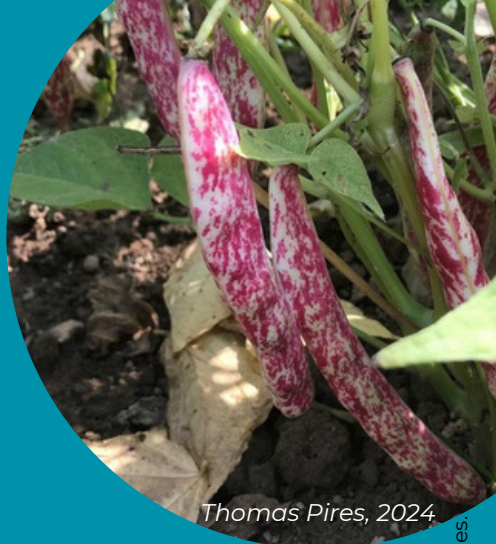
Thomas Pires, 2024