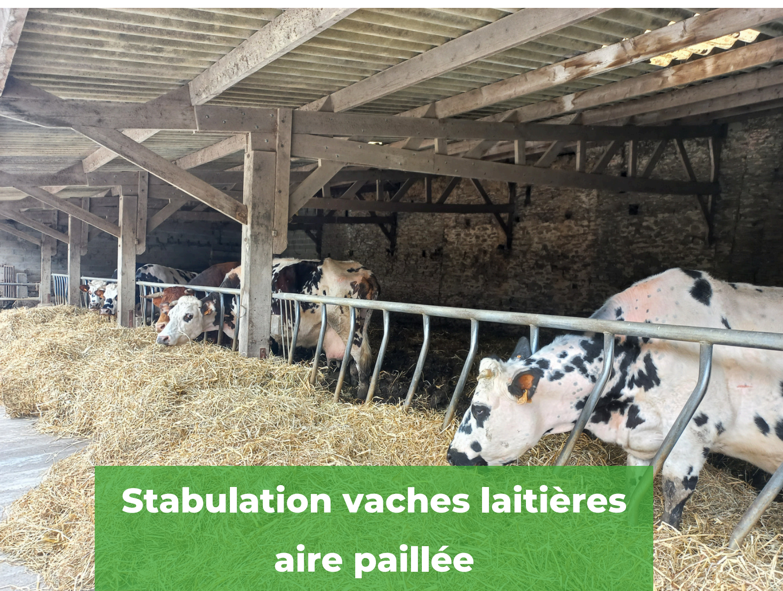
Stabulation vaches laitières aire paillée