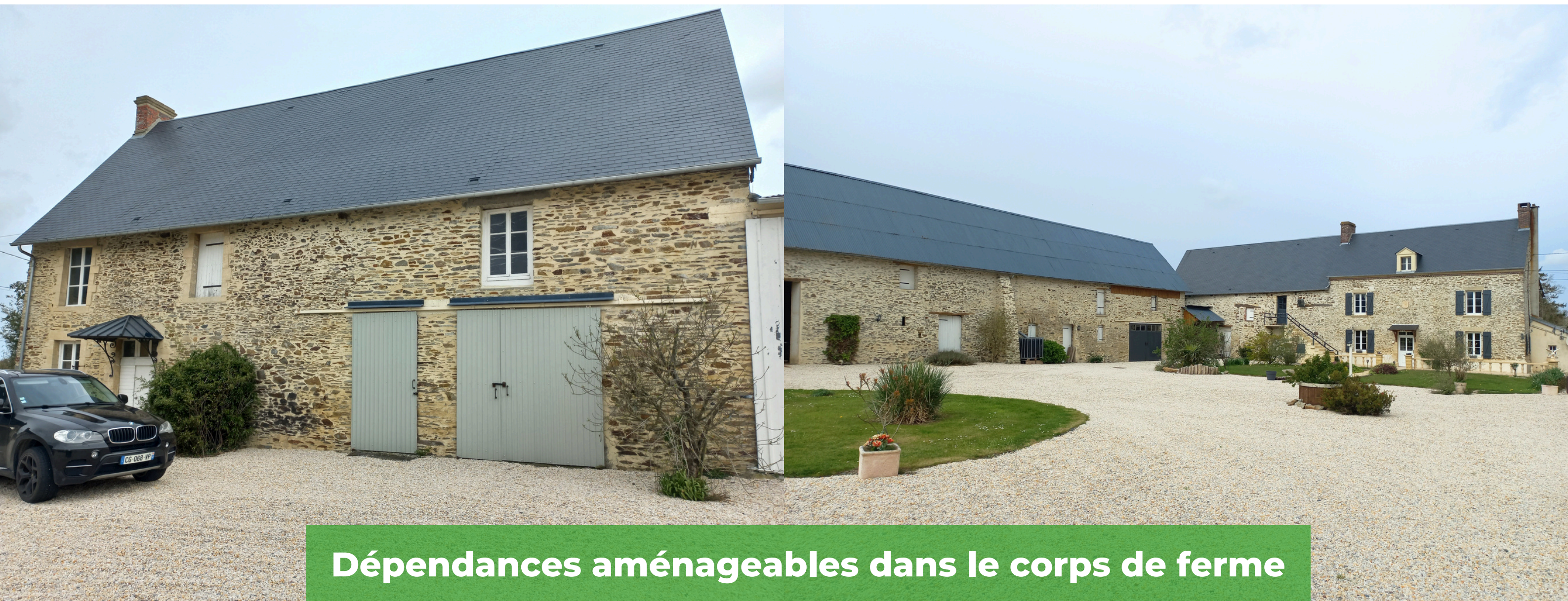
Dépendances aménageables dans le corps de ferme