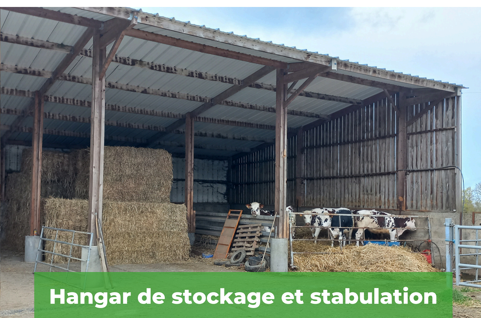
Hangar de stockage et stabulation