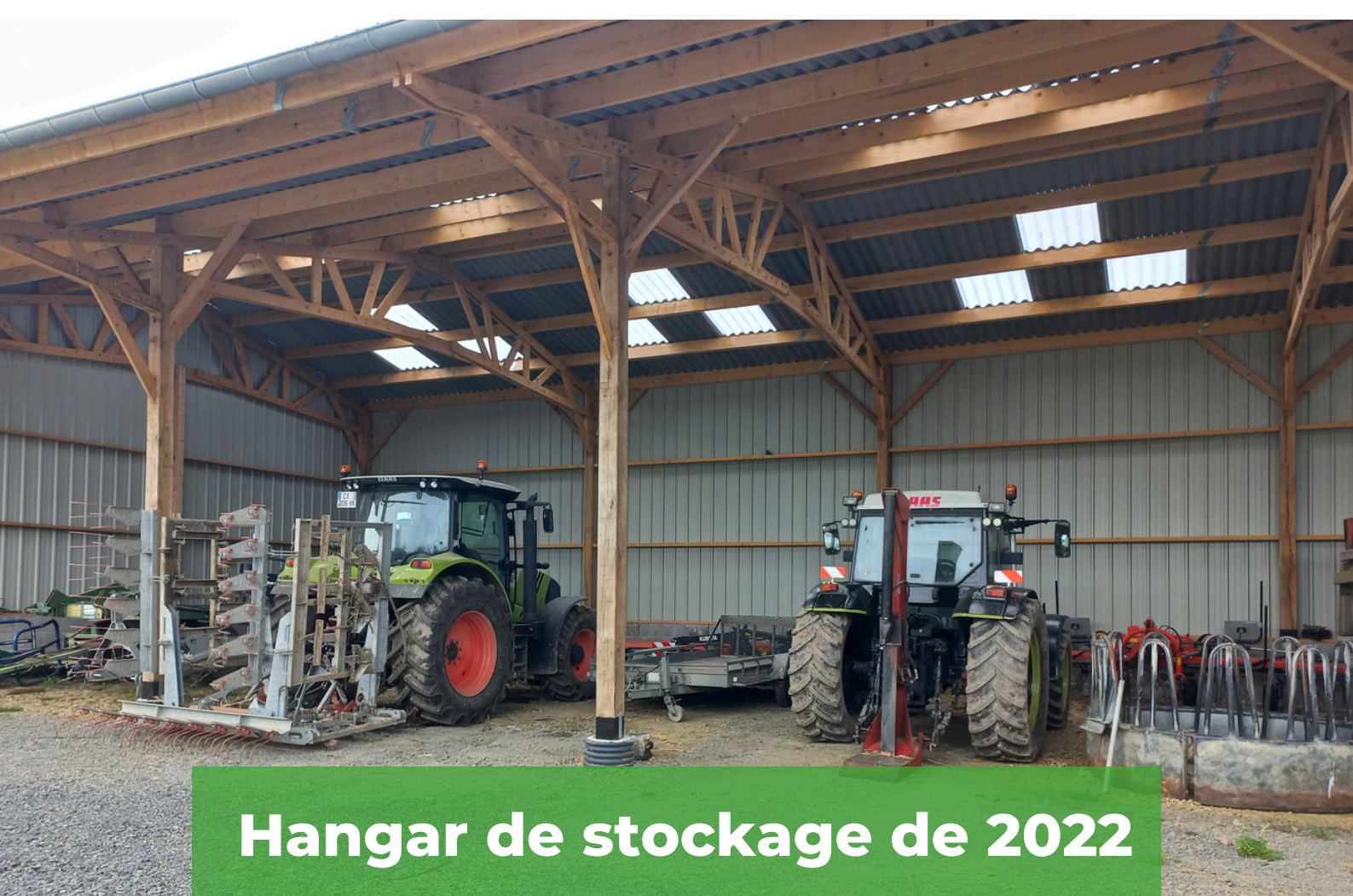
Hangar de stockage de 2022