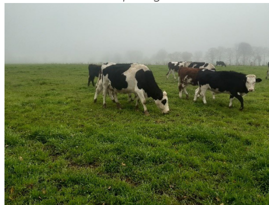
Fin novembre 2020 | Une génisse et sa mère

• Les mères sont de nouveau traitées. Il n'y a pas de difficulté pour le sevrage et le retour en salle de traite. Avec de l'herbe de qualité elles redonnent du lait.