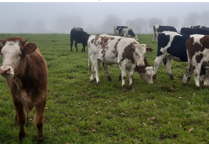
Novembre 2020 | Génisses de 8 mois